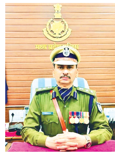
साझा कर रहे हैं। इस दौरान वे न केवल अपने कार्य से जुड़े मुद्दों पर चर्चा करते हैं, बल्कि एक-दूसरे के भावनात्मक और मनोवैज्ञानिक पहलुओं को भी समझने का प्रयास कर रहे हैं।