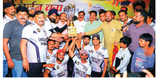
हरिभूमि न्यूज मुंगावली