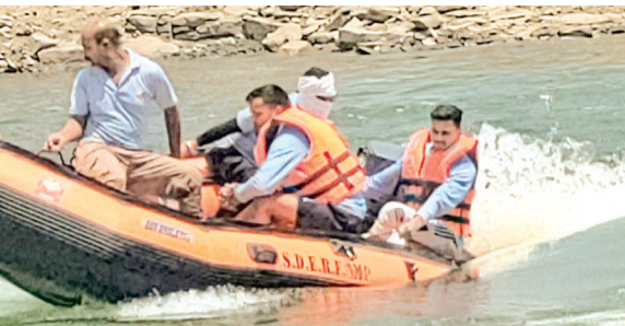
हरिभूमि न्यूज बीना