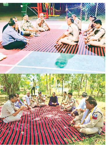
इस पहल ने पुलिस बल के भीतर आपसी तालमेल और भरोसे को मजबूत किया है। सुख दुख में सहभागी बनने की भावना से एक सशक्त टीम का निर्माण हो रहा है, जो बेहतर

कार्यप्रणाली की दिशा में सकारात्मक संकेत है। इसी क्रम में 21 अप्रैल को थाना कोतवाली, दिगोड़ा और देहात क्षेत्रों में थाना प्रभारियों द्वारा अपने अपने स्टाफ के साथ चाय पर चर्चा कार्यक्रम आयोजित किया गया। इस दौरान कर्मचारियों ने अपनी पारिवारिक, आर्थिक और व्यक्तिगत समस्याओं को साझा किया। अधिकारियों ने इन समस्याओं को गंभीरता से सुनते हुए त्वरित समाधान के प्रयास किए। जिन मामलों में उच्च स्तर की आवश्यकता थी, उन्हें पुलिस अधीक्षक के समक्ष प्रस्तुत किया गया। एसपी इस पहल अंतर्गत प्राप्त फीडबैक पर लगातार नजर बनाए हुए हैं और इसके सकारात्मक प्रभावों को निर्यात समीक्षा भी कर रहे हैं। उनका उद्देश्य है कि यह नवाचार पुलिस बल के भीतर संवेदनशीलता, सहयोग और विश्वास को और अधिक मजबूत करे। क्योंकि मजबूत पुलिस व्यवस्था केवल सख्ती से नहीं, बल्कि संवेदनशीलता और संवाद से भी बनती है।